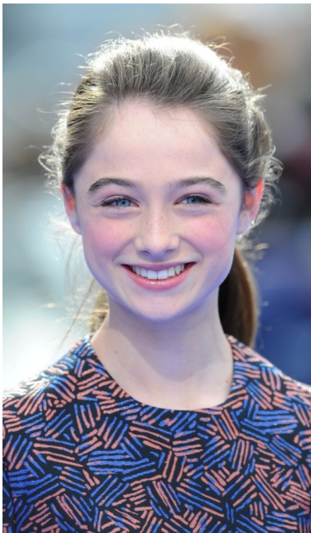
Рэффи Кэссиди Актриса

Одной из важных ролей в карьере юной актрисы, стала Афина в фильме режиссера Брэда Бёрда «Земля будущего» (2015), где партнерами Рэффи выступили Джордж Клуни и Хью Лори.