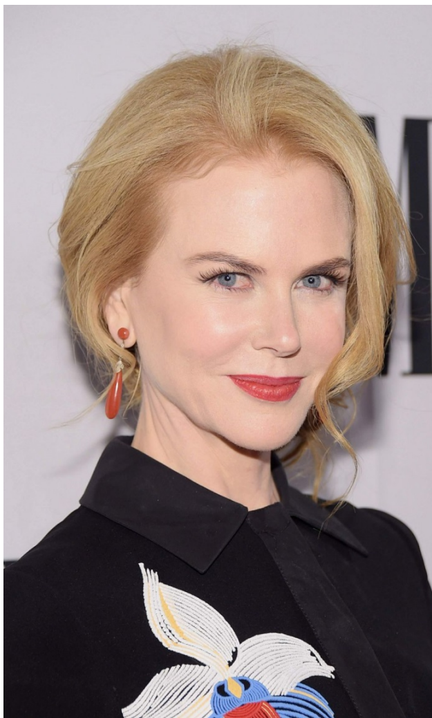
Николь Кидман Актриса

Австралийская актриса и продюсер. Лауреат премии «Оскар» за роль в фильме «Часы». Также является лауреатом премий «Золотой глобус», «Эмми», «Сатурн» и «Серебряный медведь».